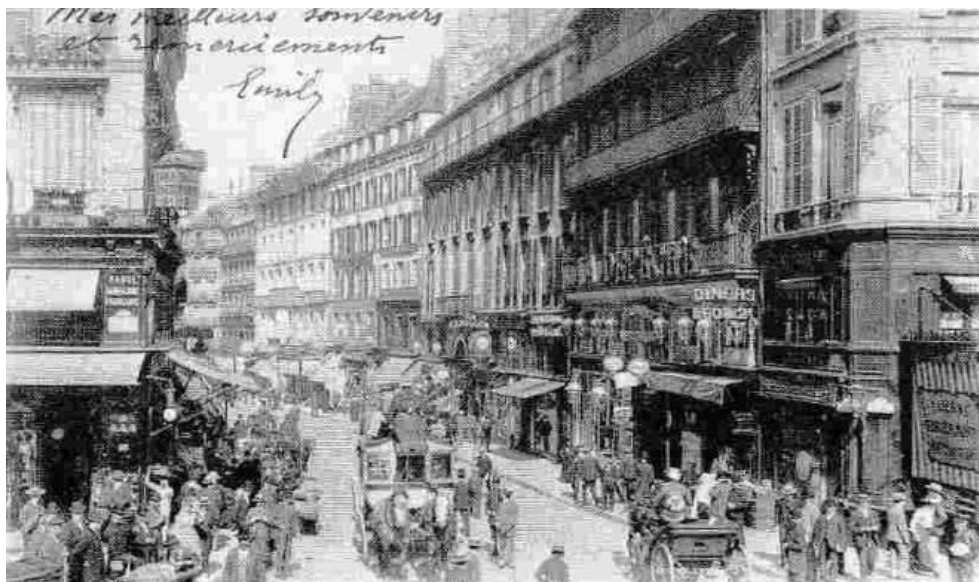
Figure 5. Le Brabant