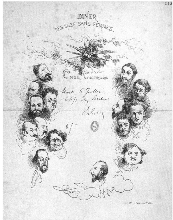
Figure 2. Invitation, « Mardi 6 Juillet — 6 h ½ chez Brebant »

Toutefois, en ce qui concerne la biographie vernienne, il y a lieu de se méfier, de ne pas suivre aveuglément les publications précédentes. Revenons par conséquent aux sources premières. Selon les deux lettres d'invitation connues (Figures 1 et 2), les réunions doivent avoir lieu « Mardi 4 mai » et « Mardi 6 juillet », sans indication d'année [4]. Les endroits prévus respectifs sont : le « restaurant de la Belle Gabrielle » à Suresnes, à l'ouest de Paris ; et « Brebant [sic] », à la rive droite.