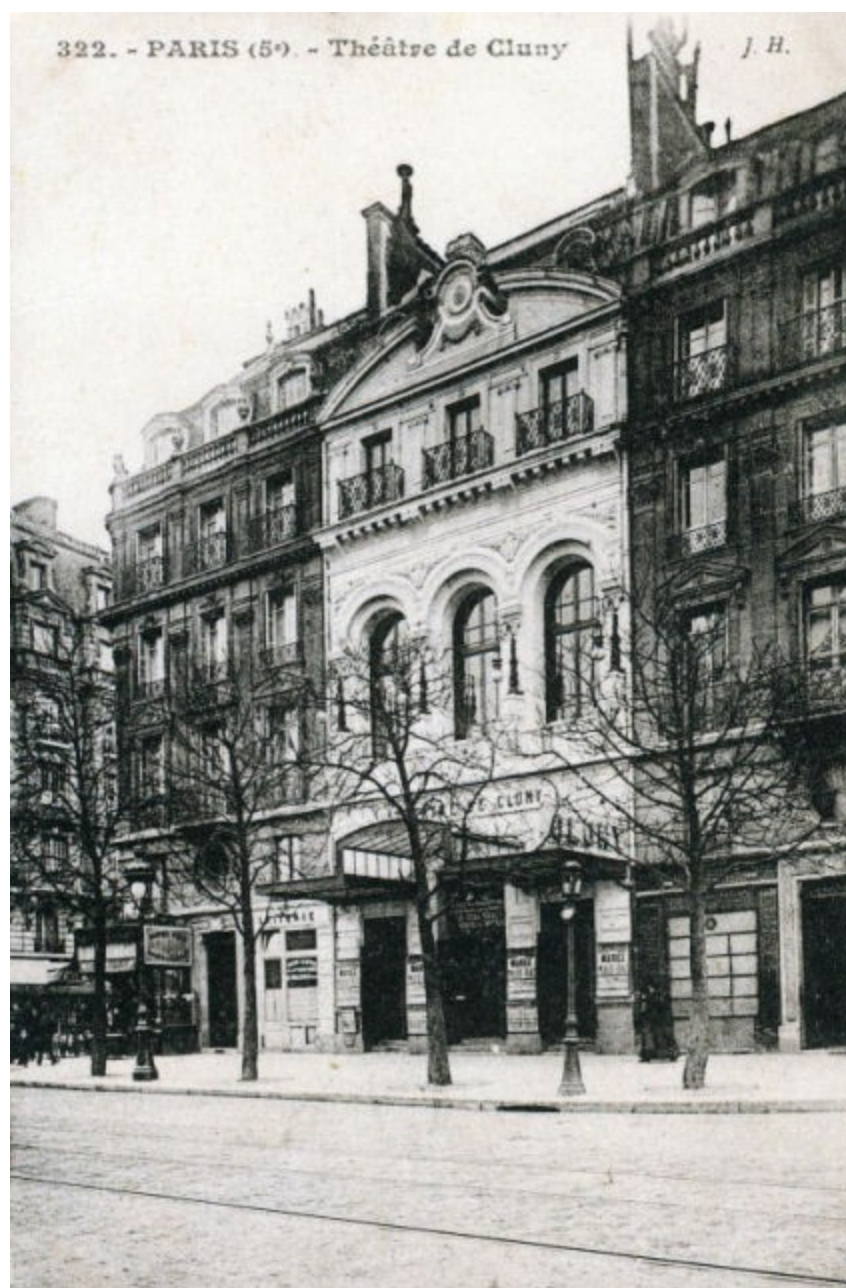
Théâtre de Cluny